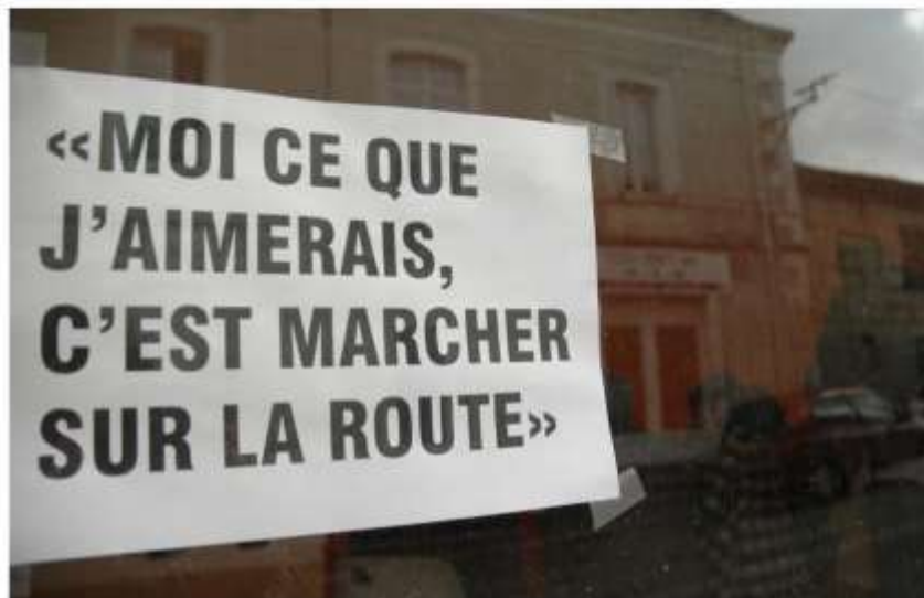
Atelier d'urbanisme utopique Mazières-en-Gâtine (79)